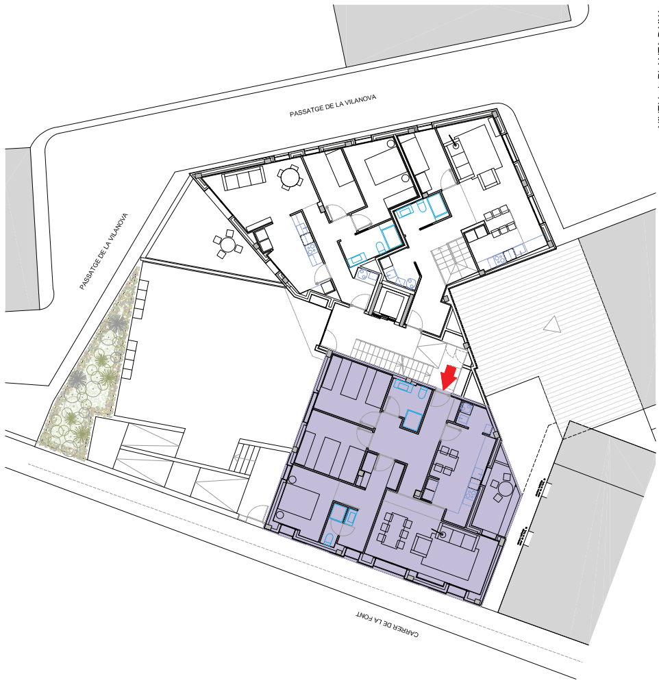
NIVELL 1. PLANTA BAIXA